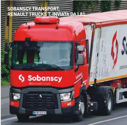
SOBANSKY TRANSPORT, RENAULT TRUCKS T, INVIATA DA L81