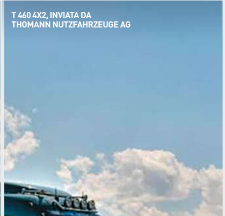
T 460 4X2, INVIATA DA THOMANN NUTZFAHRZEUGE AG