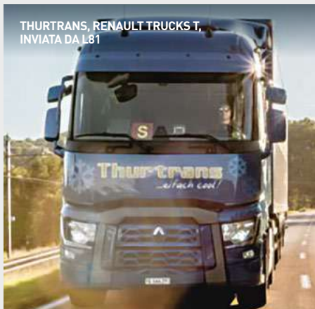
THURTRANS, RENAULT TRUCKS T, INVIATA DA L81