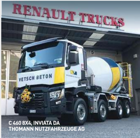
C 460 8X4, INVIATA DA THOMANN NUTZFAHRZEUGE AG