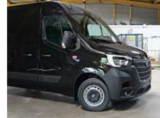
SCOPRI IL NUOVO RENAULT TRUCKS MASTER RED EDITION