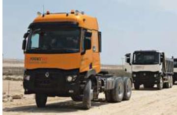
EVENTO XPERIENCE DAYS: BAHREIN 2019, I MOMENTI MIGLIORI