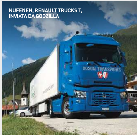
NUFENEN, RENAULT TRUCKS T, INVIATA DA GODZILLA