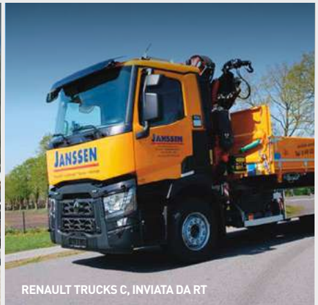
RENAULT TRUCKS C, INVIATA DA RT