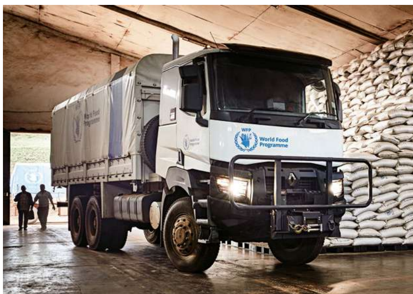
Il nuovo veicolo del WFP, un Renault Trucks K 6x6, verrà consegnato in Ghana nel 2020.

Da oltre 20 anni, Renault Trucks integra i principi dello sviluppo sostenibile nella sua strategia e nelle attività quotidiane. Il marchio è particolarmente attento al proprio impatto ambientale, alla responsabilità come datore di lavoro e al proprio impegno civico.