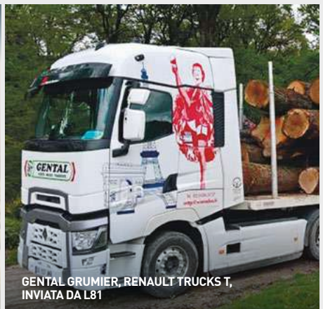
GENTAL GRUMIER, RENAULT TRUCKS T, INVIATA DA L81