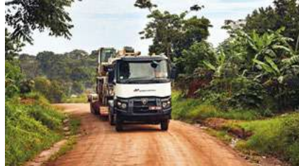
NEL MONDO RENAULT TRUCKS K: ROBUSTO, COMODO E AFFIDABILE