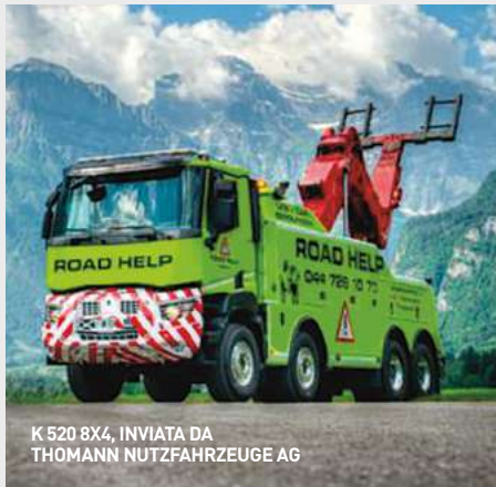
K 520 8X4